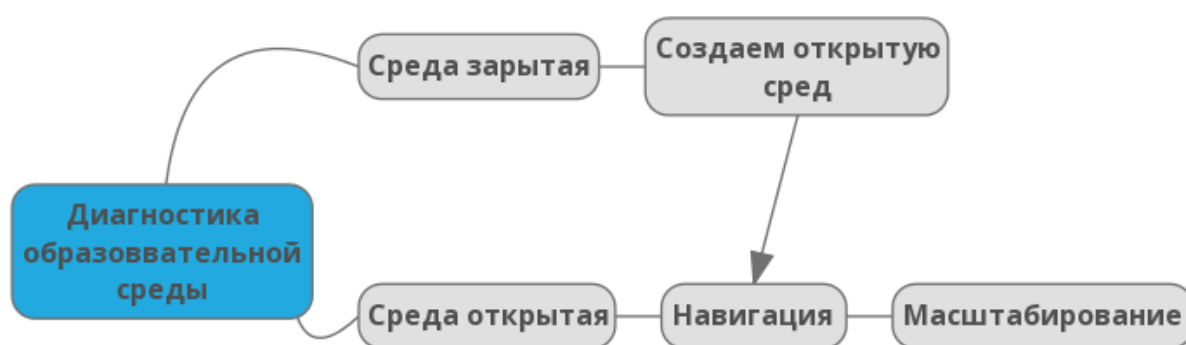
Схема 2. Модель диагностики образовательной среды

Исследование научной литературы и собственный опыт взаимодействия с тьюторами учреждений СПО показали положительную работу данной модели и необходимость включения дополнительных составляющих кроме навигации и масштабирования. В зависимости от особых потребностей обучающегося такими составляющими могут быть интеграция, обскурация, универсализация, генерализация и пр.